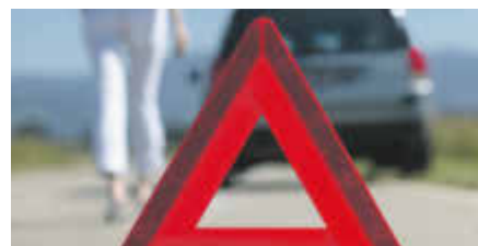
Das Warndreieck ist in einer Entfernung von mindestens 100 Metern vom Fahrzeug aufzustellen.