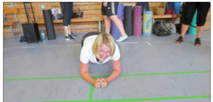
Aufgabe Nr. 1: halten, halten, halten