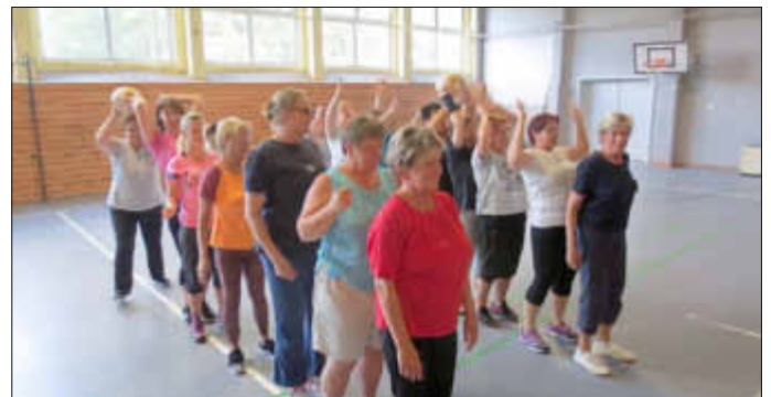
Aufgabe Nr. 5: Organisation eines Mannschaftswettbewerbes in 30 Sekunden, Fotos: G. Schmidt