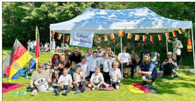
Gruppenfoto Team und Fans

Möglich wurde diese Reise durch die finanzielle Unterstützung in Höhe von 1.000 Euro von der Norddeutschen Energie WP Plauerhagen III GmbH & Co.KG aus Rerik. Der Sponsor ist Betreiber des Windparks Plauerhagen III GmbH & Co. KG. Im Rahmen seiner wirtschaftlichen Tätigkeiten unterstützt der Sponsor als sozial- und umweltverantwortliches Unternehmen im Einvernehmen mit der Stadt Lübz Vorhaben von den in der Region verwurzelten Vereinen, Organisationen oder Privatpersonen zur Förderung des Gemeinwohls. Dafür bedanken sich die D-Junioren des Lübzer Sportvereins sehr herzlich.