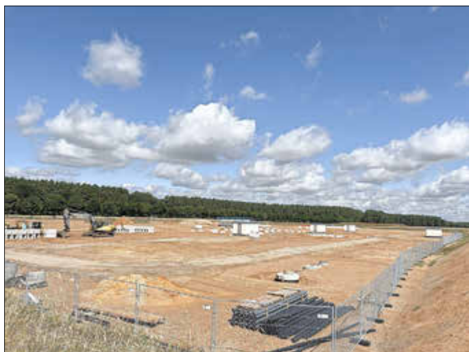
Baubeginn für das neue Umspannwerk in Vietlübbe bei Parchim

Im Umspannwerk finden die unterschiedlichen Bestrebungen starker Unternehmen ein gemeinsames Ziel. So wie die WNG den Netzausbau verfolgt, sucht UKA als großer Energieparkentwickler nach Möglichkeiten, den grünen Strom aus nachhaltigen Projekten bestmöglich einspeisen zu können. Bereits 2020 begann UKA deshalb mit der Planung eines Umspannwerkes, um seine in Vietlübbe geplanten Windkraftanlagen ins Stromnetz der WNG zu integrieren. Gemeinsam setzten beide Partner das Vorhaben nun in die Tat um.