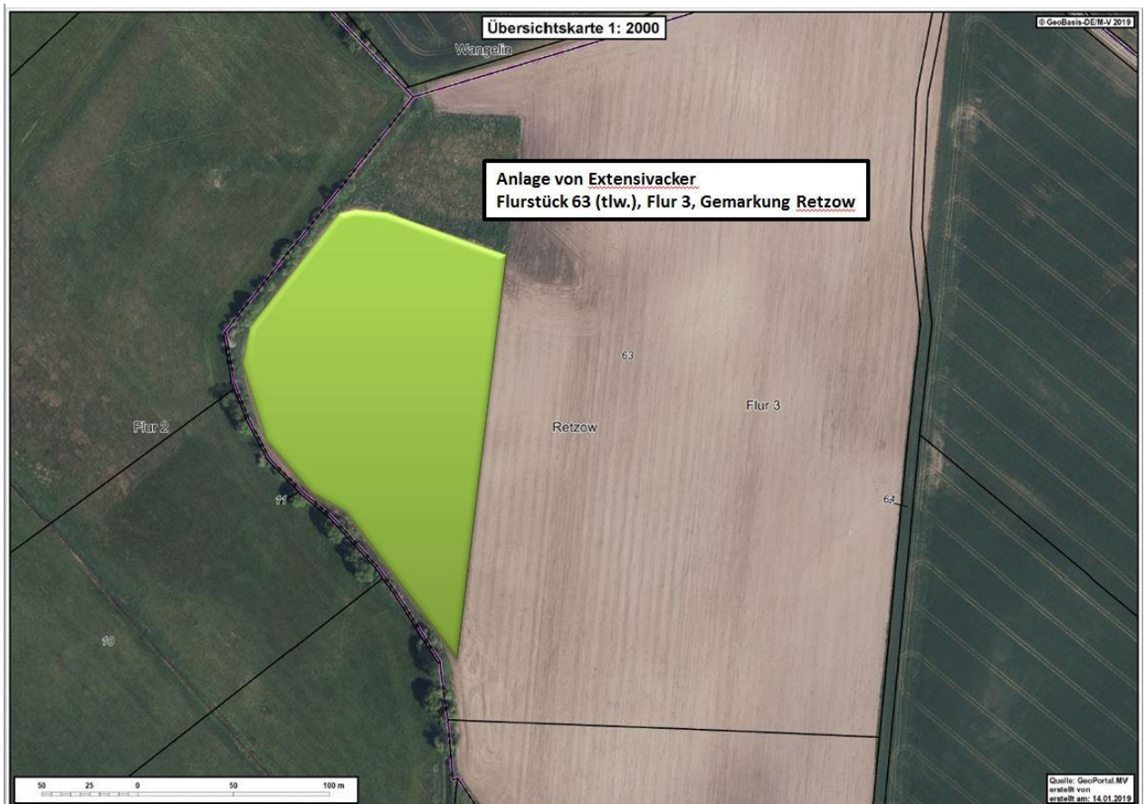
Abbildung 1: Luftbildauszug ( http://www.gaia-mv.de/gaia/gaia.php )