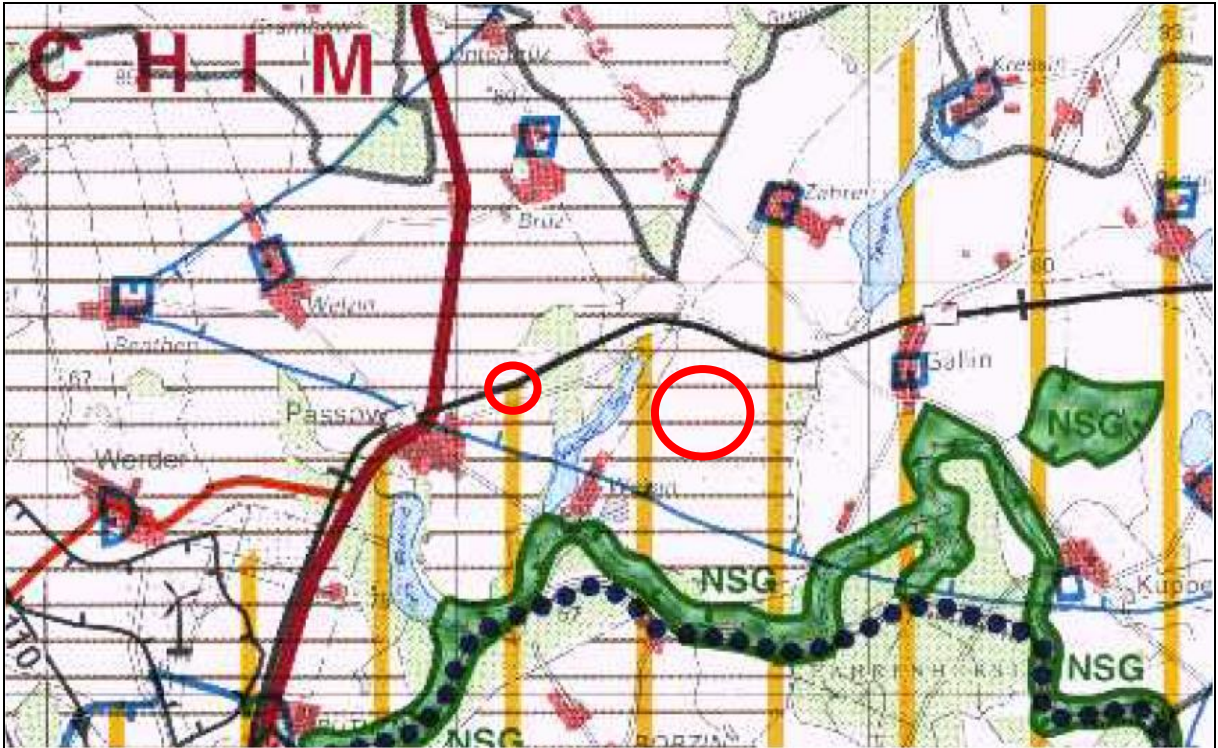
Abbildung 1: Ausschnitt aus dem RROP Westmecklenburg (Lage Planungsraum Planteil 1 und 2 rot markiert)

Aufgrund der Lage des Plangebietes innerhalb eines Raumes mit besonderer natürlicher Eignung für die Landwirtschaft und innerhalb eines Fremdenverkehrsentwicklungsraumes ist eine Prüfung des Einzelfalls für die Belange der Landwirtschaft und der Fremdenverkehrsentwicklung erforderlich.