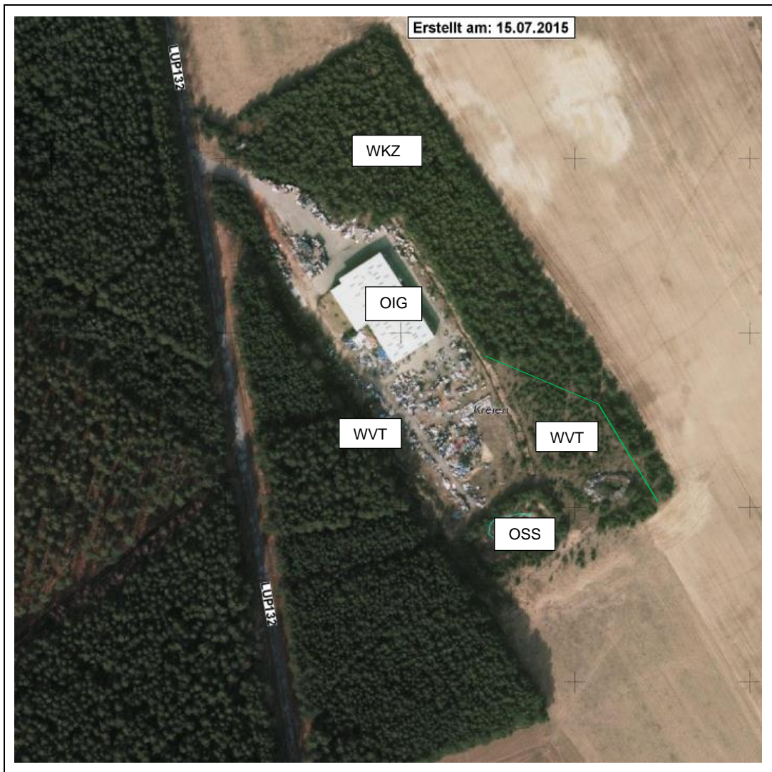
Abbildung 1 - GAIA Überflug März 2011