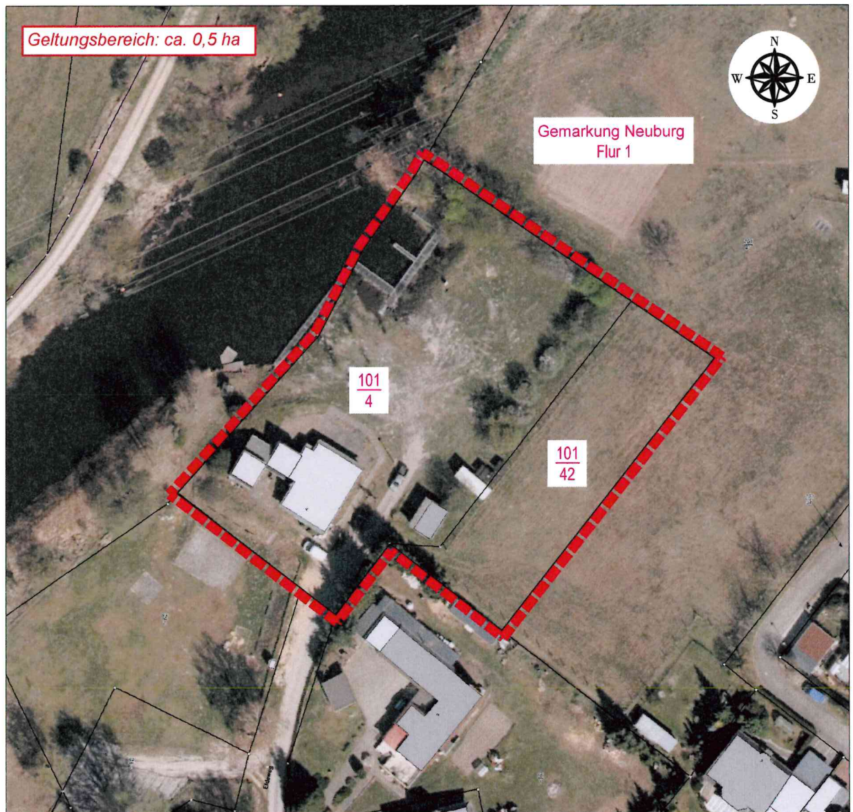
Bebauungsplan der Gemeinde Siggelkow "Wasserwanderrastplatz Neuburg" Ausgrenzung