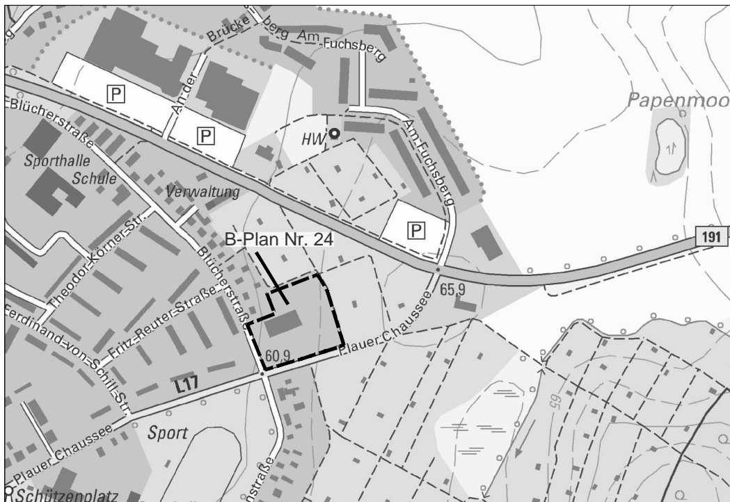
Abgrenzung Geltungsbereich auf Grundlage der Topografischen Karte 1 : 5000, unmaßstäblich