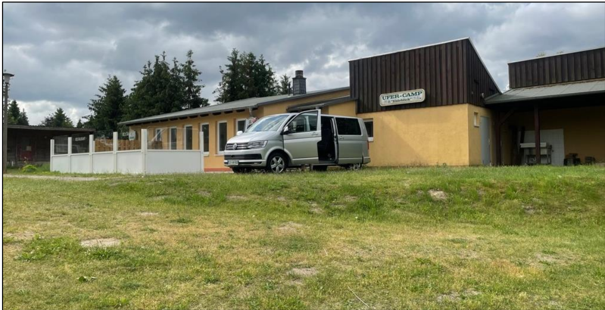
Abbildung 1: Gaststätte mit integriertem Sanitärbereich des Wasserwanderrastplatzes „Ufercamp-Eldeblick“