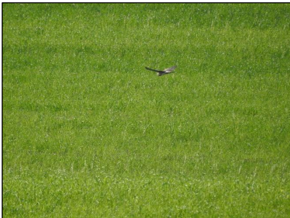
Abbildung 5: Männliche Kornweihe ( Circus cyaneus / MV 1, BRD 1, EG, EGG) auf Nahrungssuche.