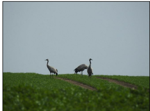
Abbildung 6: Kraniche ( Grus grus ) rasten auf „Passow 2“.