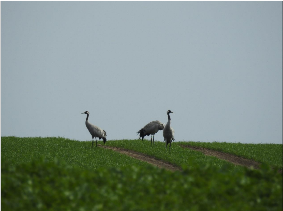
Abbildung 1: Rastende Kraniche ( Grus grus ) auf der landwirtschaftlich genutzten Ackerfläche von Passow 2.