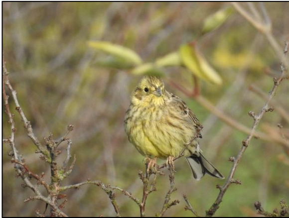
Abbildung 3: Goldammer ( Emberiza citrinella / MV V, BRD) in der Gehölzinsel beim Hochstand.