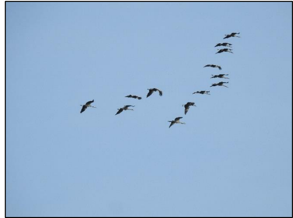
Abbildung 4: Kraniche ( Grus grus ) im Überflug.